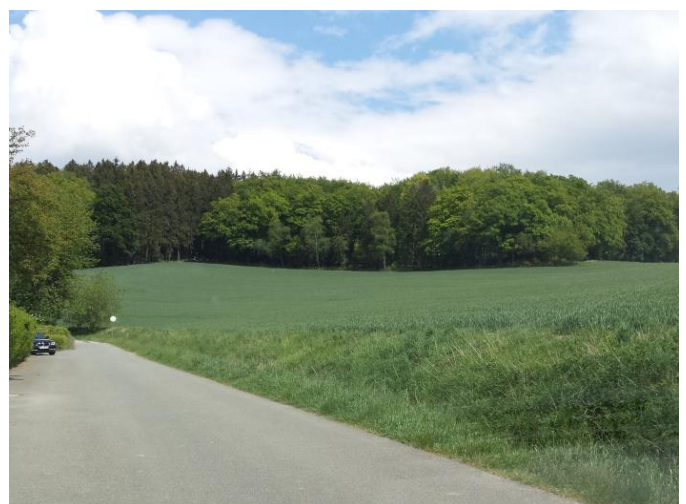
Abb. 3: Ferienhausgebiet mit östlicher Reservefläche (li.: Luftbild; re.: Reservefläche als landwirtsch. Anbaufläche)