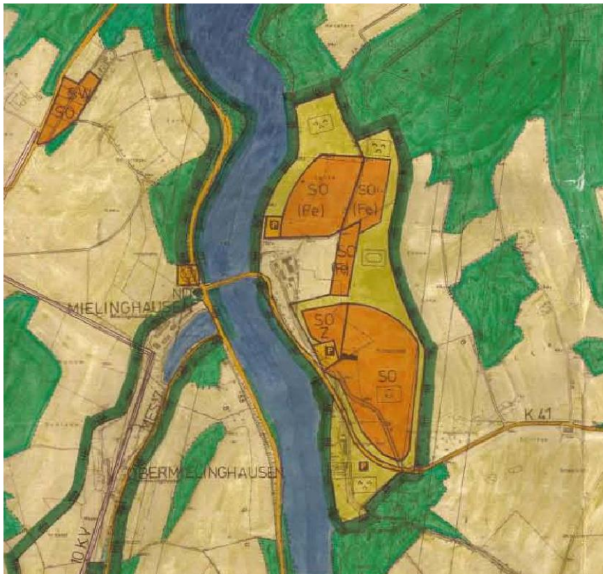
Abb. 6: Ausschnitt aus dem wirksamen Flächennutzungsplan

Die ca. 2,2 ha große Freifläche nordöstlich der Straße „Ober der Hassel“ ist aufgrund ihrer Funktion als Reservefläche für Ferienhäuser als Sondergebiet mit der Zweckbestimmung Ferienhausgebiet (SO-Fe) dargestellt.