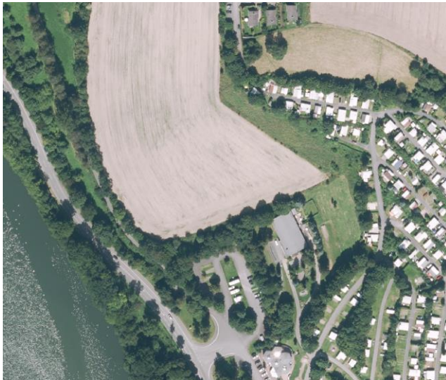
Abb. 2: Nördliche Entwicklungsfläche Campingplatz

Der Flächennutzungsplan stellt eine ca. 1,42 ha große Fläche nördlich des Campingplatzes als Sondergebiet mit der Zweckbestimmung „Zentrale Einrichtungen“ dar. Die Entwicklungsabsichten aus den Siebziger Jahren, an dieser Stelle Unterkünfte für Bedienstete, Verwaltungsgebäude und Versorgungseinrichtungen unterzubringen, kamen nie zum Tragen. Zum jetzigen Zeitpunkt wird die Fläche ausschließlich als Ackerland genutzt. In Zukunft ist nicht mehr von einer Entwicklung in Richtung zentraler Einrichtungen auszugehen, da sich diese bereits an anderer Stelle auf dem Campingplatzgelände befinden. Durch die Änderung des Flächennutzungsplans soll die bestehende Situation korrekt dargestellt und für zukünftige Entwicklungen sinnvoller ausgestaltet werden. In diesem Zusammenhang ist auch der Zuschnitt der Fläche inklusive der Parkplatzfläche zu korrigieren.