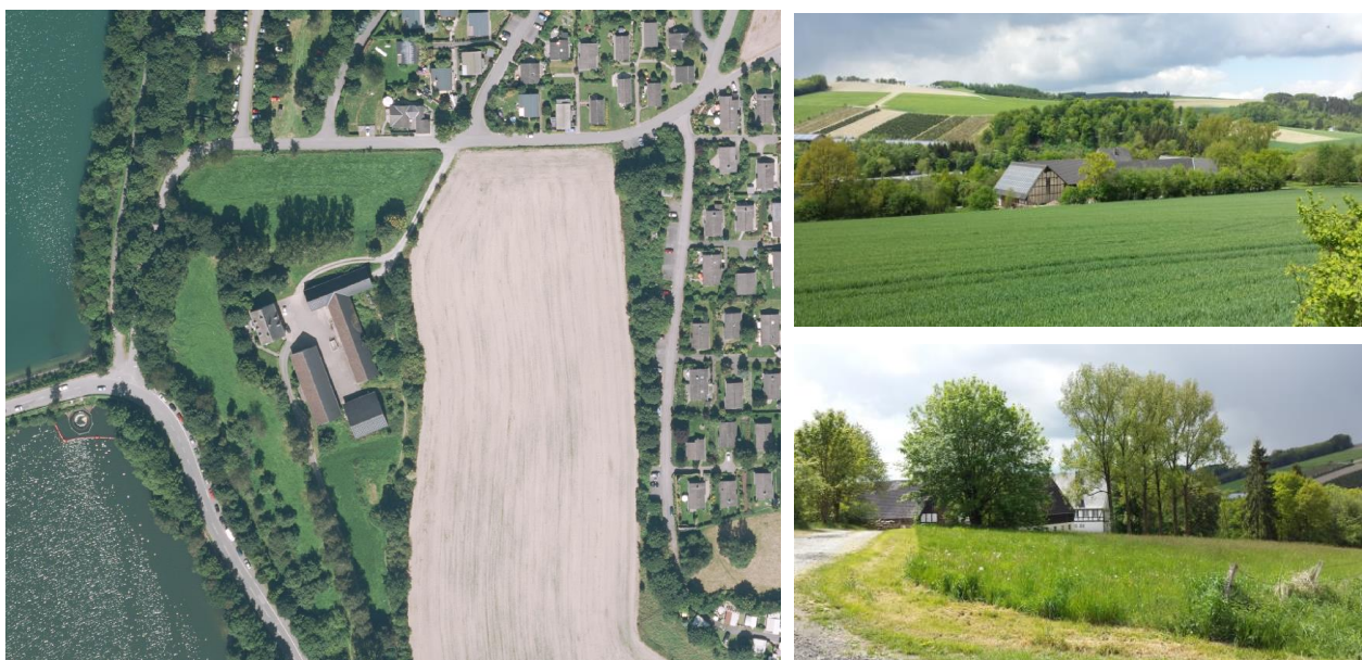
Abb. 1: Hofstelle mit angrenzenden Freiflächen (li. Luftbild; re. Aufnahmen von Norden und Osten)

Ein Ziel der vorliegenden Änderung des Flächennutzungsplans ist es demnach, die Darstellung der „Fläche für die Landwirtschaft“ in ein „Sondergebiet Erholung – Ferienbauernhof“ auf Ebene der vorbereitenden Bauleitplanung planungsrechtlich zu sichern.